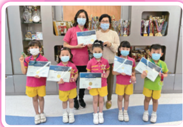
香港學界朗誦大賽