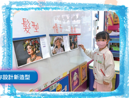
多多不要難過，我為你設計新造型