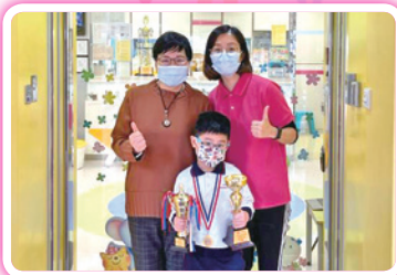
香港國際數學競賽總決賽2020+ 全港幼稚園朗誦比賽