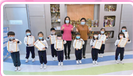
GAPSK幼稚園普通話水平考試