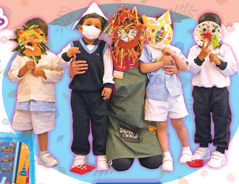
我們為多多創作的作品